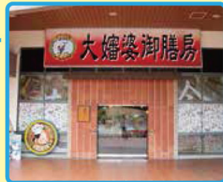
（餐廳地下一樓設免費停車場）